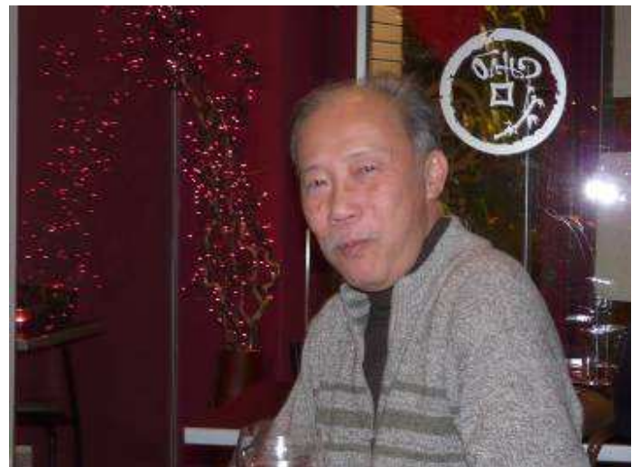
Thiên ... content ... (remarquez : « Chào »)