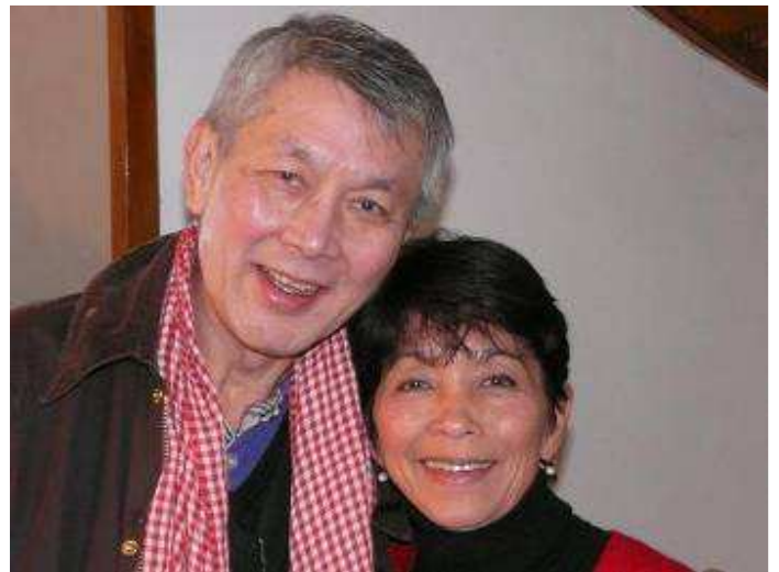
Le binôme (de Mathi) : remarquer le foulard Khmer rouge