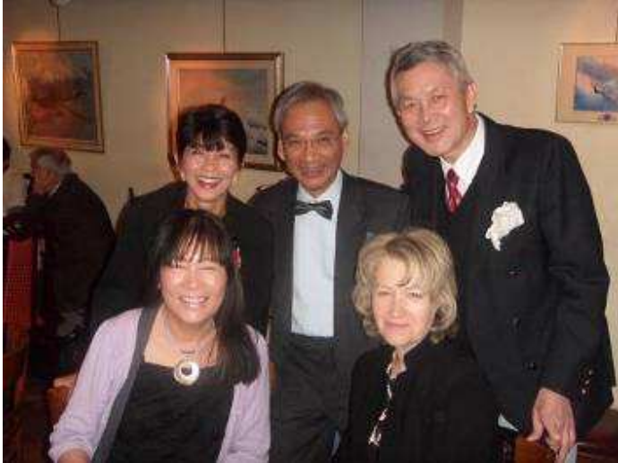
Le verre de l'Amitié avant le Gala