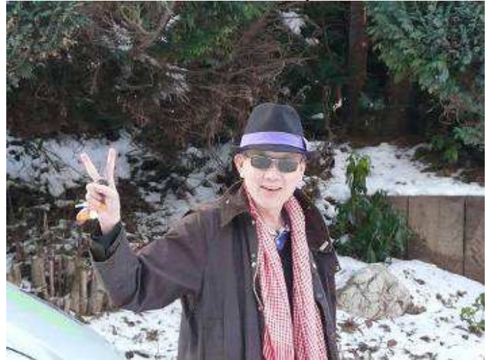
17h12 : Arrivée de RTTT