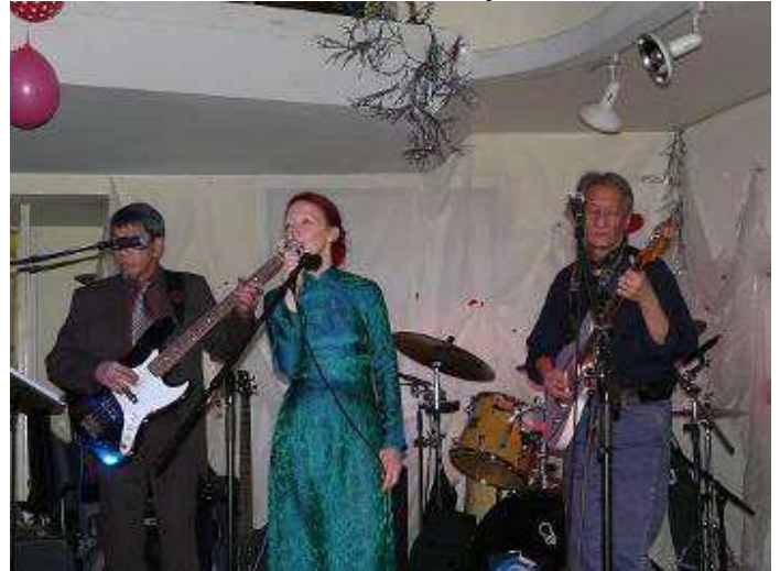
The Rice Cooker : Nắng Chiều (soirée , oui , mais surtout pas ensoleillé pas un seul brin de soleil depuis 36 heures )