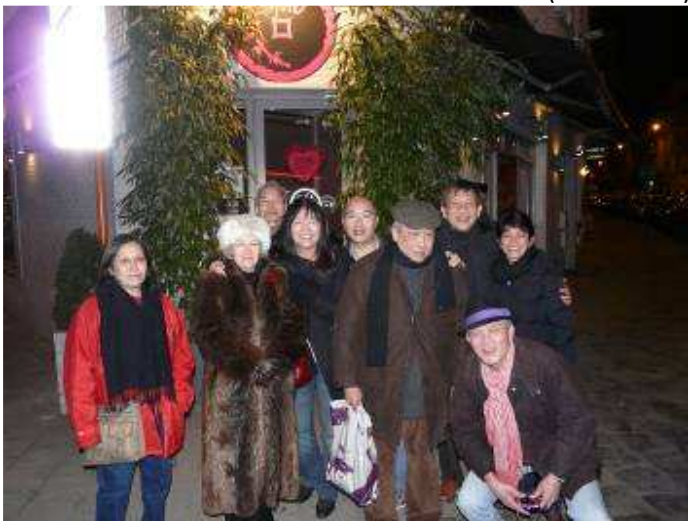
23h14 - La fin du jour J-1

23h45 - Le 2 ème mi-temps à « la Bécasse » d'Ixelles