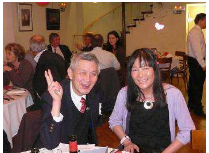
RTTT et MyLinh