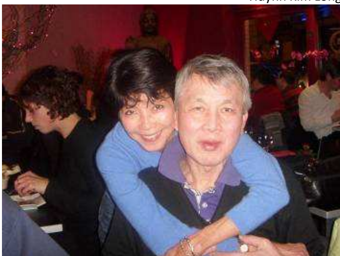
Le même binôme mais sans foulard khmer rouge ...