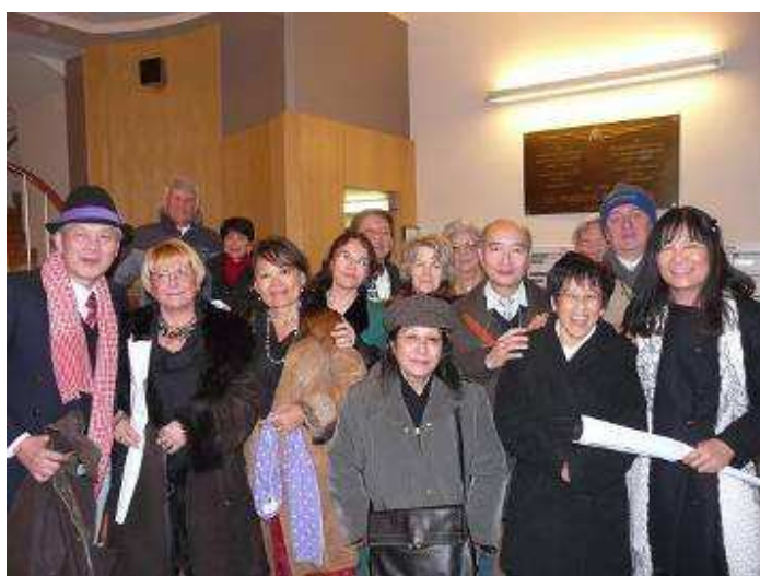
1h14 – « finie la soirée !!! »