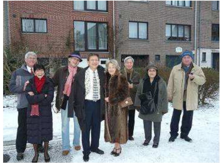
17h44 – arrivée à la Maison des Ailes