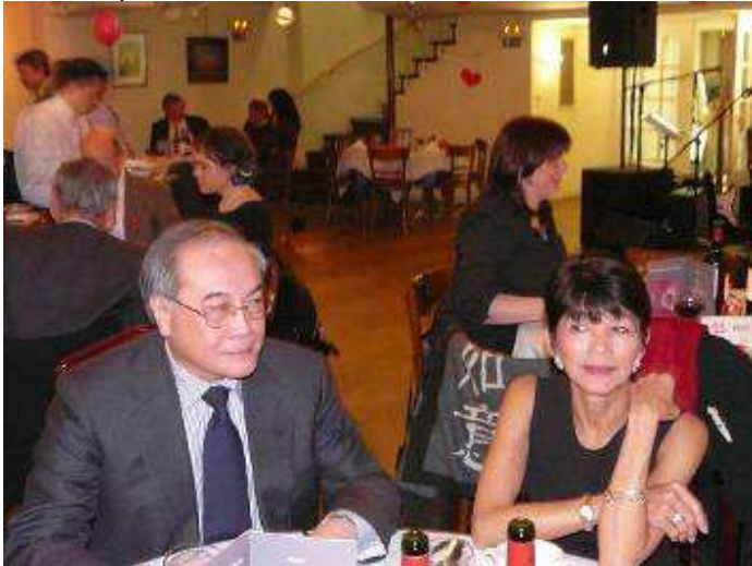
GNCD et CâmVân