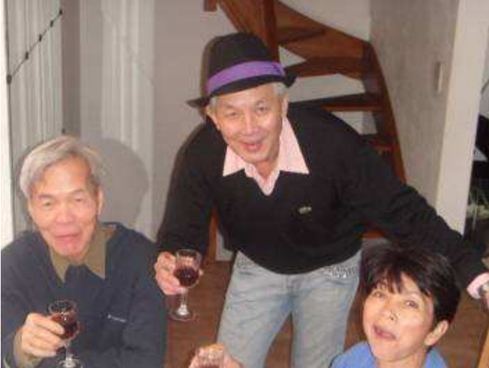
In the meanwhile ...