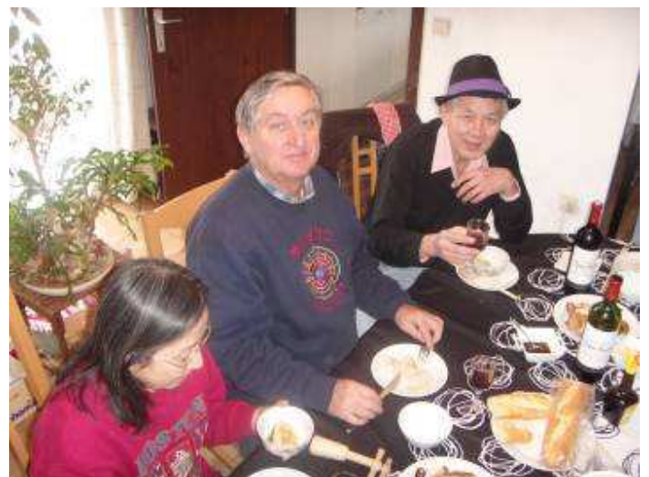
2 bánh chung et 2 Saint Emilion , mine de rien ...