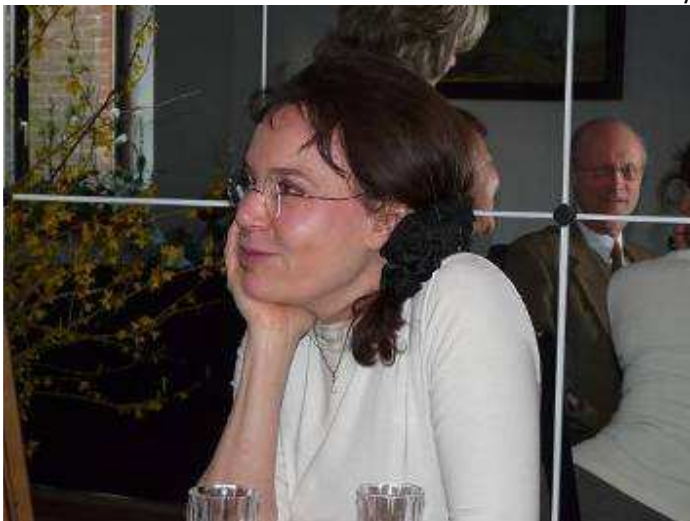
L'autre enfant de DàLat