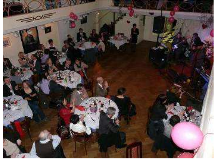
Vue de la galerie haute