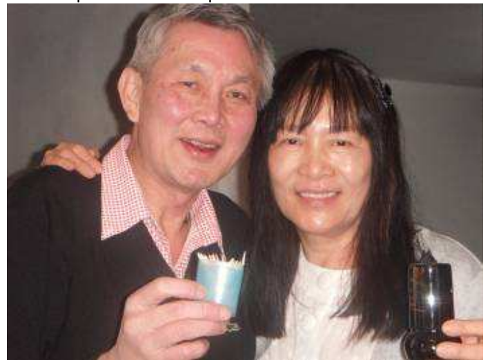
Non, ce n'est pas pour boire – ni pour manger !