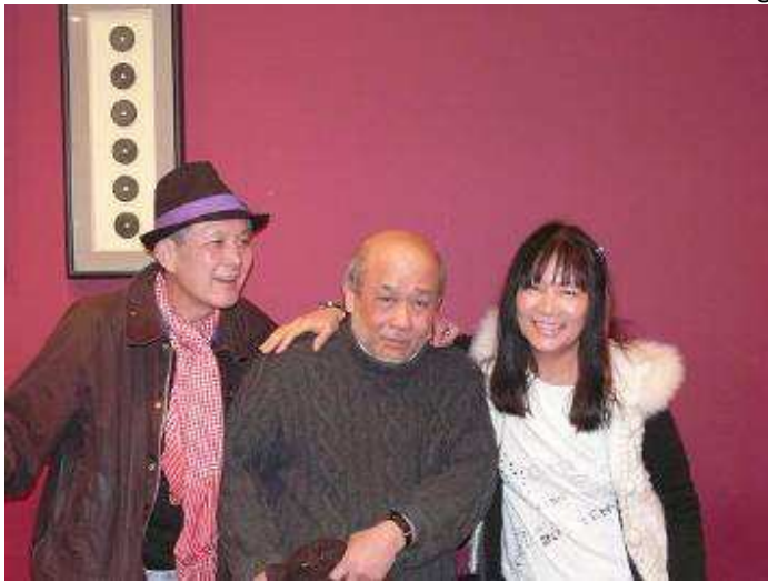
RTTT, Long et MyLinh