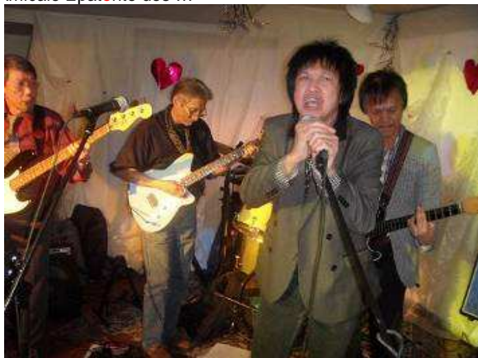
Et autres Rock'n Roll