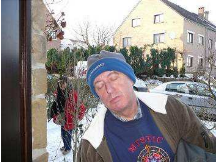
15h : Arrivée des Châtelains des Sables