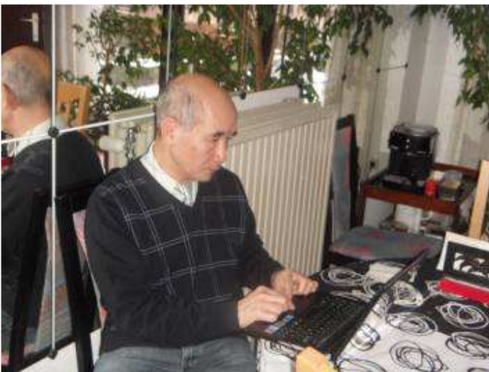
Votre envoyé spécial en action --d'autant moins méritoire vu le « superbe » temps --