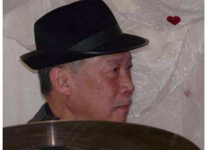
Thiên le batteur