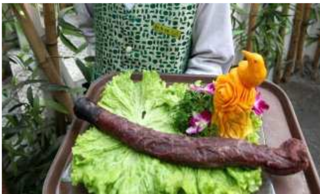
Một tiếp viên của nhà hàng Guolizhuang bưng món "cùa quí" của lừa. Đối với người Trung Quốc, việc thưởng thức "cùa quí" của động vật không đơn thuần là phép thử sự dũng cảm. Họ coi món này một phương pháp chữa bệnh cho những người yếu sinh lý.