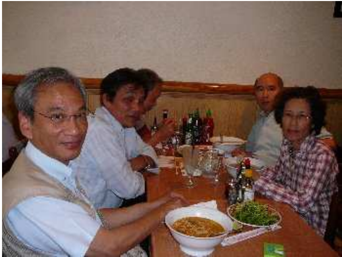
Honnête_Belge est un peu caché par BDT (ScEx, JJR65) (AD et Scribouillard = hu? tiu, les 3 autres = ba'nh canh)