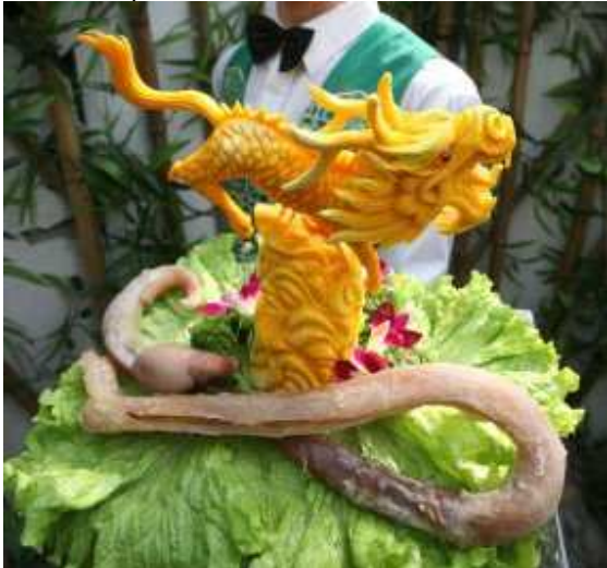
Đĩa 'cùa quí' của bò Tây Tạng.