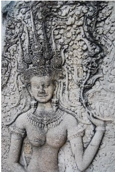
AngKor , par purple_cloud, mars-2008