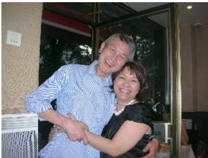
nouvelle conquête de délégué_65 !!!

Quoi/Comment : FETE de la VICTOIRE... suite à un tournoi amical de TENNIS entre JJR