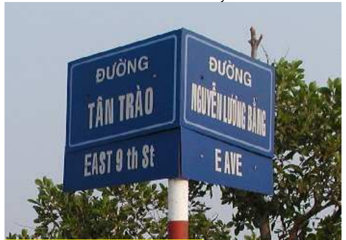
Une photo exclusive par scribouillard

Thậm chí, nhiều tên nổi tiếng như Lê Lai, Trần Hưng Đạo... được dùng đi dùng lại 3-4 lần nên bao năm nay việc tên đường trùng ở TP HCM là một vấn đề đau đầu với người dân. Theo báo cáo của các cơ quan chức năng, hiện Sài Gòn có tới 100 tên đường trùng nhau.