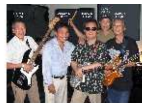
Rice Cooker 2008

Dès lors je vous demande de confirmer vos inscriptions en envoyant le chèque à Georges dont voici les coordonnées: