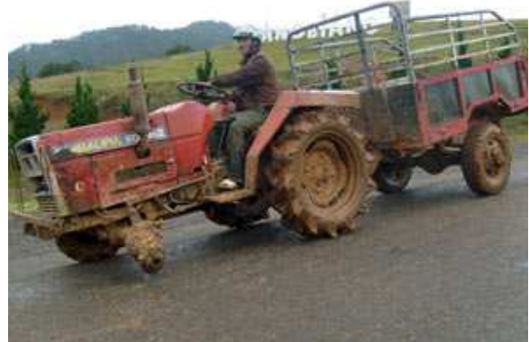
Ảnh do độc giả Phan Lê Bảo Anh chụp tại cao nguyên Lang Biang. (11-2008)

Chiếc máy kéo rơi mất một bánh nhưng tay lái lùa này vẫn vô tư đổ đèo.