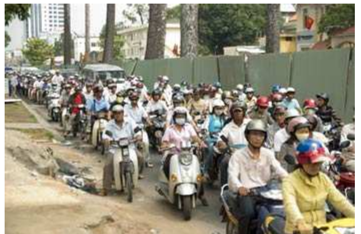
Scènes de vie quotidienne à .... 4