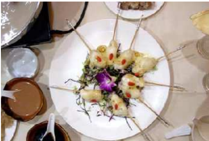
'Cùa quí' của cừu được coi là món ăn đặc trưng của nhà hàng Guolizhuang. Khi chế biến, 'cùa quí' của cừu được phủ mayonnaise, pho mát ngọt.